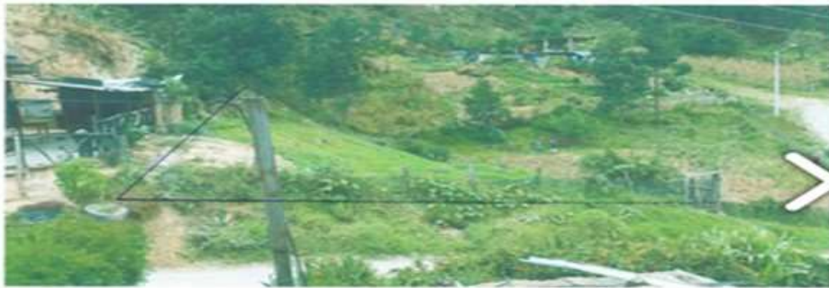
PARTE FRONTAL DEL LOTE DE TERRENO PROPIEDAD DE: SRA. NORMA PIEDAD CUMBE ZHANAY