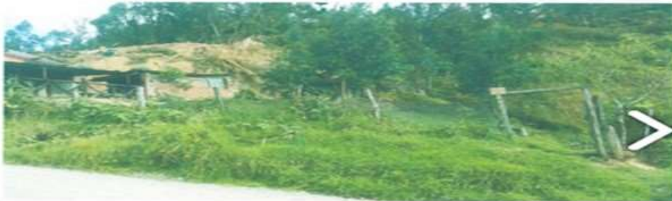
PARTE FRONTAL DEL LOTE DE TERRENO PROPIEDAD DE: SRA. NORMA PIEDAD CUMBE ZHANAY